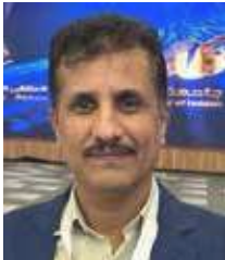
د. ناصر احمد بن حبتور