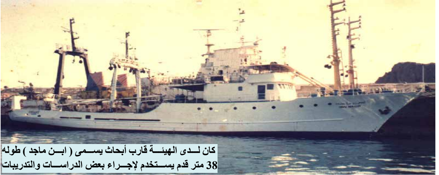
كان لدى الهيئة قارب أبحاث يسمى ( ابن ماجد ) طوله 38 متر قدم يستخدم لإجراء بعض الدراسات والتدريبات

رسم سياسة وخطط الهيئة مجلس إداري برئاسة رئيس الهيئة وتحت إشراف الأخ/ وزير الثروة السمكية . ويحتوي الهيكل الإداري للهيئة على فرعين في المحافظات الساحلية في كل من محافظتي حضرموت والحديدة ويرأس كل منهما مدير عام مرتبط ارتباطا مباشرا مع رئيس الهيئة. كما يحتوي الهيكل الإداري على مركزين وثلاثة أقسام بحثية ، وتتبع هذه